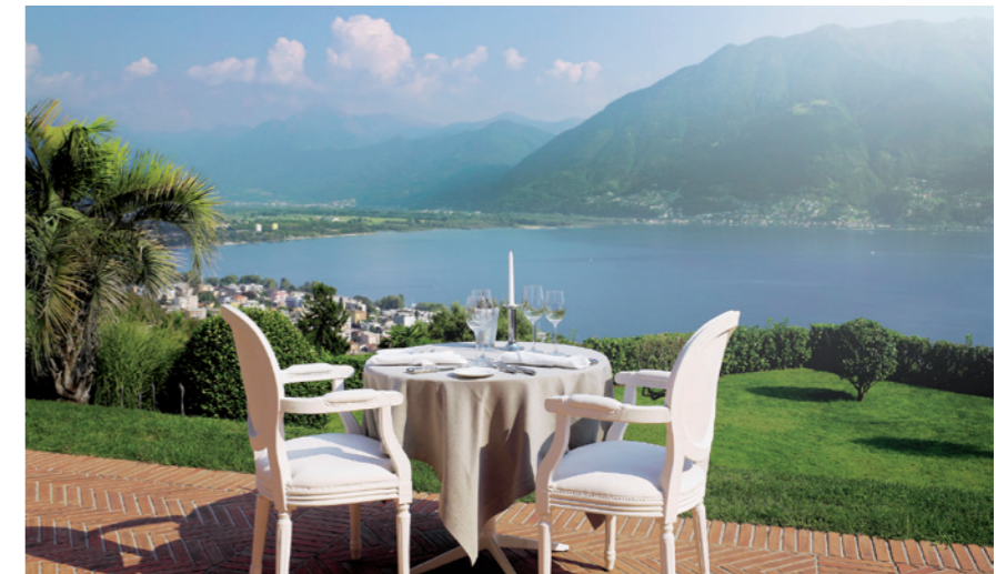
Was für ein Plätzchen für ein Essen zu zweit. Ein Dinner auf der Terrasse des Restaurants Di Villa Orselina ganz nach italienischer Art mit bestem Blick auf Locarno

Die 28 Zimmer und Suiten sind Wohlfühlorte. Helle, hohe Räume, weiße Sessel, nichts ist zu viel, nichts übertrieben, nichts zu cool. Auf den Betten fehlt der Überwurf, reine Absicht, so ist es wie zu Hause. Vom Balkon aus hat man wieder die tollste Aussicht auf den Lago. Sie alle sind einfach geschmackvoll, stylish mit einem Augenzwinkern und bieten alles an Luxus, was der verwöhnte Gast so