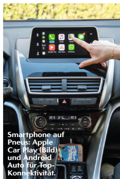
Smartphone auf Pneu: Apple Car Play (Bild) und Android Auto für Top-Konnektivität.

Mitsubishi Eclipse Cross Motor 1.5-R4-Benziner, 163 PS Antrieb 6-Gang-Schaltung oder CVT-Automat, 4x2 oder 4x4 Fahrleistungen 0 bis 100 km/h in 9,3 bis 10,3 s; Spitze 200 bis 205 km/h Verbrauch 6,6 bis 7,0 l/100 km = 151 bis 159 g/km CO 2 , Energieeffizienz G Preis ab 23.999 Franken