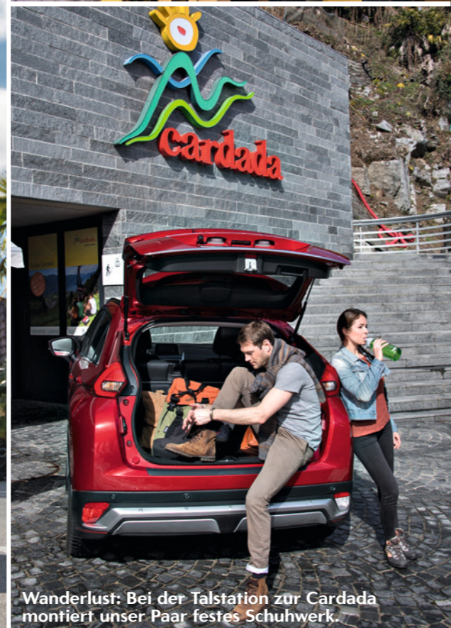
Wanderlust: Bei der Talstation zur Cardada montiert unser Paar festes Schuhwerk.