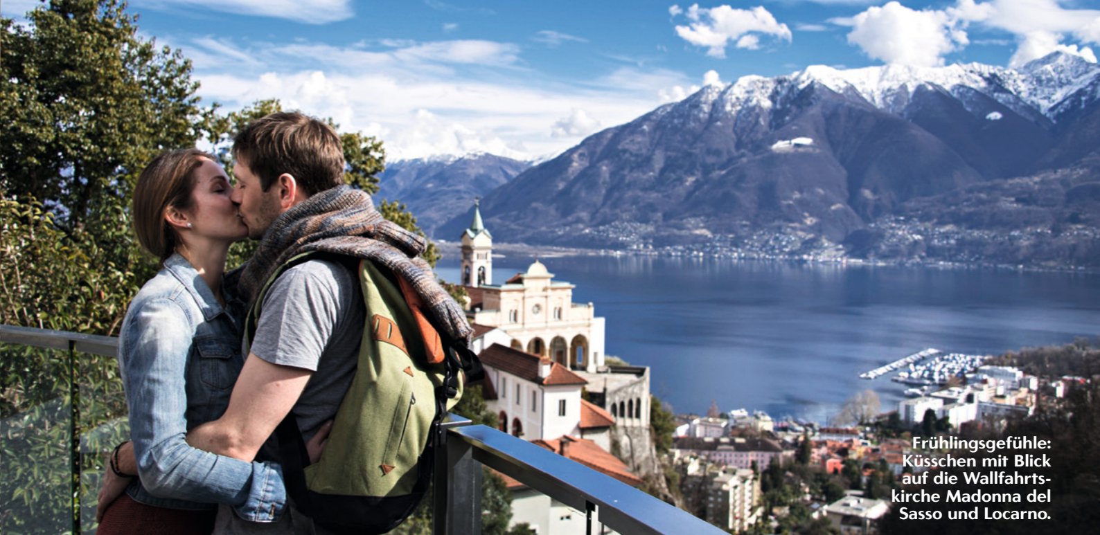
Frühlingsgefühle: Küsschen mit Blick auf die Wallfahrtskirche Madonna del Sasso und Locarno.