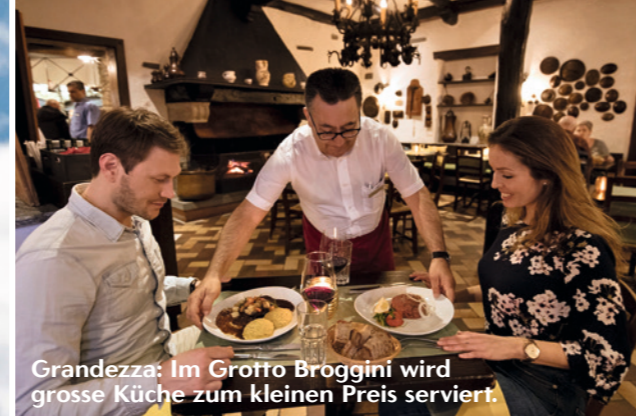
Grandeza: Im Grotto Broggini wird grosse Küche zum kleinsten Preis serviert.