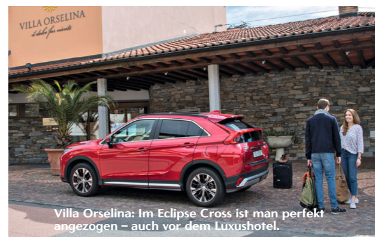
Villa Orselina: Im Eclipse Cross ist man perfekt angezogen – auch vor dem Luxushotel.

Der Sonnenhang der Sonnenstube Vor Locarno biegt Patrice ab und kurvt flott die Gässchen nach Orselina hoch. Locarnos Sonnenhang glänzt mit dem coolen Chromgrill – das neue Mitsubishi-Marken-